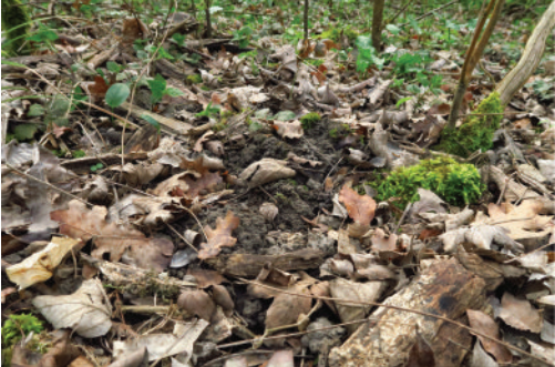
Activité importante des lombrics