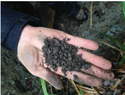
Structure grumeleuse macroagrégée