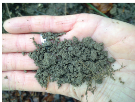
Structure grumeleuse mésoagrégée