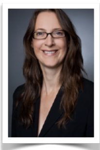
Prof. Daniela Jopp

Benvenuti al terzo bollettino informativo di SWISS100. Un'altra estate è passata! Abbiamo avuto mesi molto impegnativi per cercare di ottenere ulteriori finanziamenti per mantenere in vita il progetto. Fortunatamente, abbiamo ricevuto una buona notizia, che ci permette di continuare SWISS100 per un altro po' di tempo. Ciò significa che nei prossimi mesi potremo mandare nuovamente i nostri intervistatori a visitarvi: non vedono l'ora di rivedervi! Nel frattempo, abbiamo continuato l'analisi dei dati, condividendo i nostri risultati con altri ricercatori e con i media per creare maggiore consapevolezza sulla vita a 100 anni. E come avrete visto, uno dei nostri cari partecipanti è diventato addirittura una star della TV! Stiamo inoltre portando avanti importanti iniziative di divulgazione di SWISS100, tra cui il libro fotografico e la nostra mostra sui centenari in Svizzera, per i quali troverete maggiori informazioni qui di seguito. A nome di tutti i collaboratori di SWISS100, vorrei ringraziarvi per il vostro continuo sostegno al nostro lavoro che non sarebbe possibile senza di voi! Vi siamo molto grati per le preziose informazioni che ci permettete di avere sulle vostre vite e per le importanti lezioni che possiamo imparare da voi! Vi auguriamo un buon autunno e speriamo di risentirvi presto!