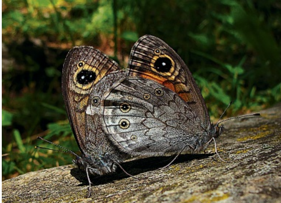
Un véritable moment de poésie ou comment un Némusien (le mâle) et une Ariane (la femelle) s'accouplent.