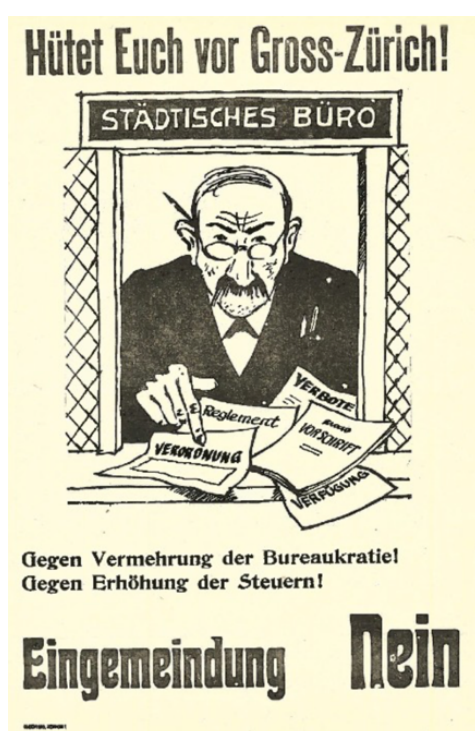
Illustration 9.2 – « Méfiez-vous du Grand Zurich ! », 1929

Note : Cette affiche de votation dénonce « l'augmentation de la bureaucratie » et « les hausses d'impôts » qui résulteraient de l'incorporation ( Eingemeindung ) des communes suburbaines dans un Grand Zurich dirigé par la majorité de gauche. Cette dernière est représentée par un « guichet municipal » bafouant les libertés à l'aide de « règlements », « interdictions » et autres « dispositions légales ».