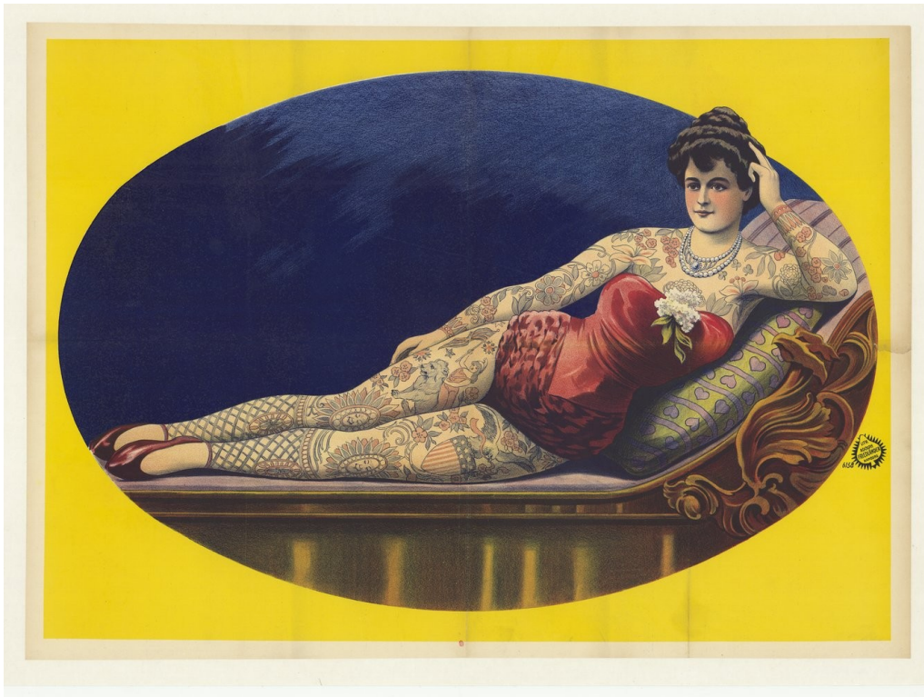
Estampe d'une femme tatouée, phénomène de cirque, Hambourg, 1913-1914.

8-12 novembre 2021, Université de Lausanne