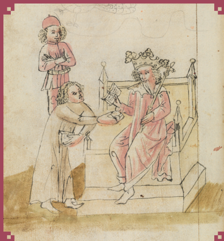
Illustration: St. Gallen, Stiftsbibliothek, Cod. Sang. 760, p. 128, xv e s., Manuel de iatromathématique du Sud de l'Allemagne/Suisse ( www.e-codices.ch/fr/list/one/csg/0760 )

directrice de recherche (CNRS – Sorbonne Université), éditrice des traités de Galien de Pergame dans la Collection des Universités de France et responsable du projet d'édition des œuvres de Galien dans cette collection, auteur de Galien de Pergame. Un médecin grec à Rome , Paris, Les Belles Lettres, coll. Histoire, 2012.