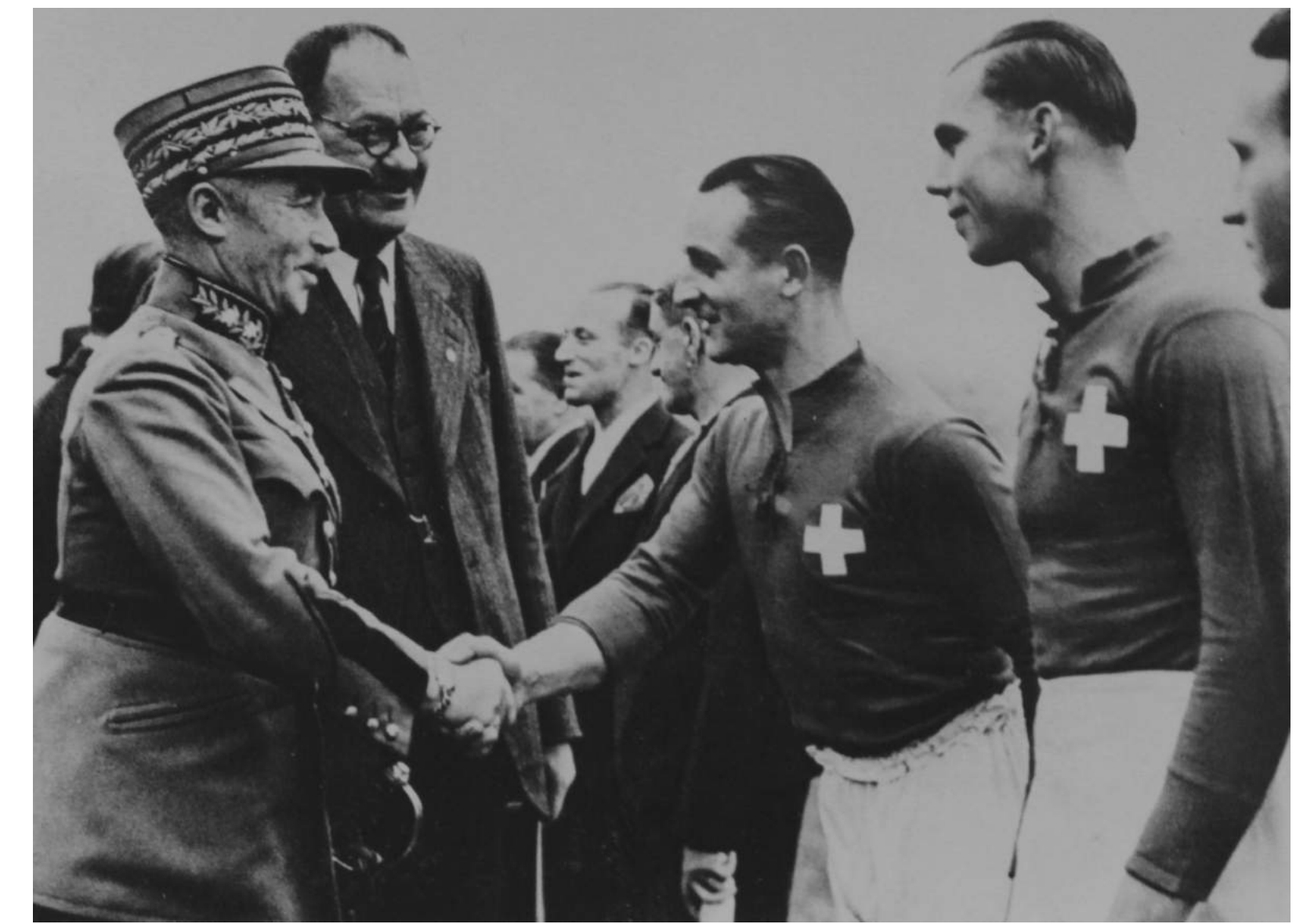
Match Suisse-Italie, 12 novembre 1938, Zurich, en présence du Général Henri Guisan

Dans cette perspective, les relations internationales sportives en Suisse seront étudiées sur la base de six moments-clés détaillés ci-dessous. Il s'agira tout d'abord d'expliquer la mise en place d'une diplomatie sportive en Suisse, de remonter aux origines des années 1930, puis de saisir l'impact de la Deuxième Guerre mondiale et de la politique commerciale de la Confédération helvétique sur ce processus. Enfin, il conviendra d'en analyser les effets jusqu'au début des années 1980, quand le Conseil fédéral octroie au CIO un statut d'organisation internationale non-gouvernementale de droit privé suisse.