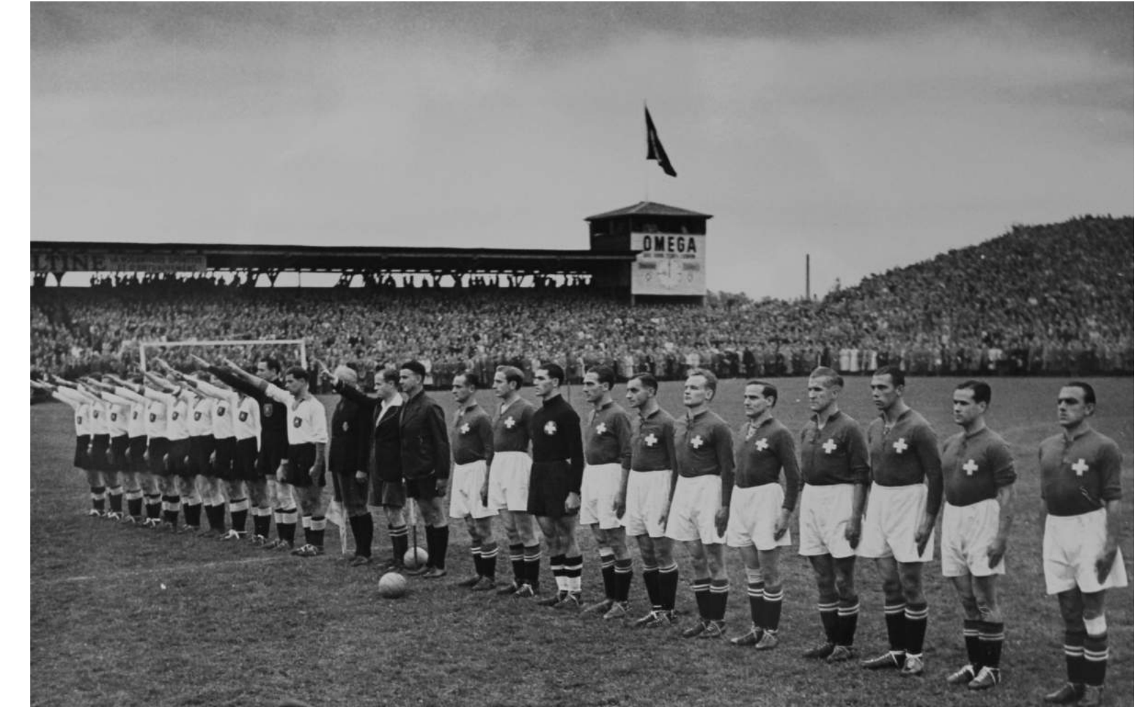
Match Suisse-Allemagne, 18 octobre 1942, Berne, Archives de l'Association suisse de football.