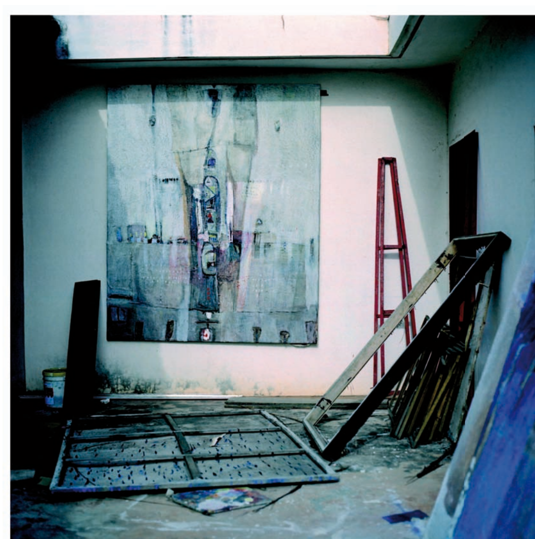
Ludovic Fadaïro, Atelier, Cotonou 2007.

Concrètement, en plus de l' analyse théorique et de la consultation de sources historiques et actuelles, locales et étrangères (archives ; littérature ; ressources filmiques et documentaires), dans le cadre de cette recherche attestant de mouvements et d'échanges transnationaux j'adopterai une posture multisituée en effectuant une double expérience de terrain au Bénin et à Haïti afin de rendre compte au mieux de l'aspect dynamique de la construction de pratiques culturelles spécifiques. Plus qu'une collecte d'informations, mes observations et entretiens (semi-directifs voire libres) entrepris avec mes interlocuteurs constitueront une expérimentation basée sur une construction ainsi qu'un processus sur un mode dialogique (Marcus 2009).