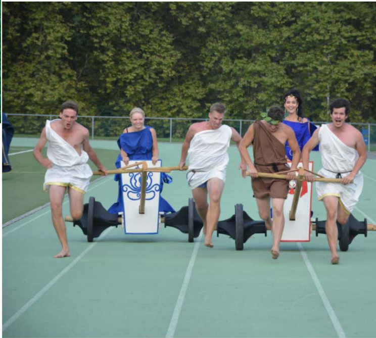
Course de biges d'hommes-chevaux