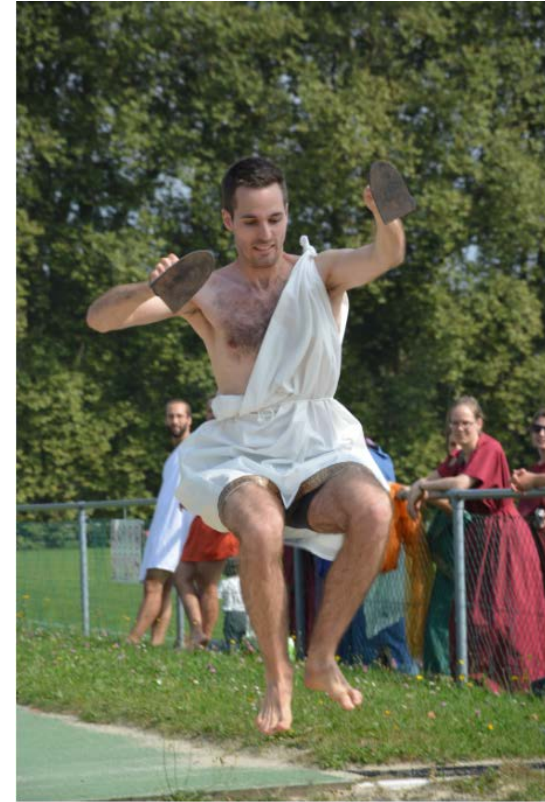
La « nudité athlétique » version 2016