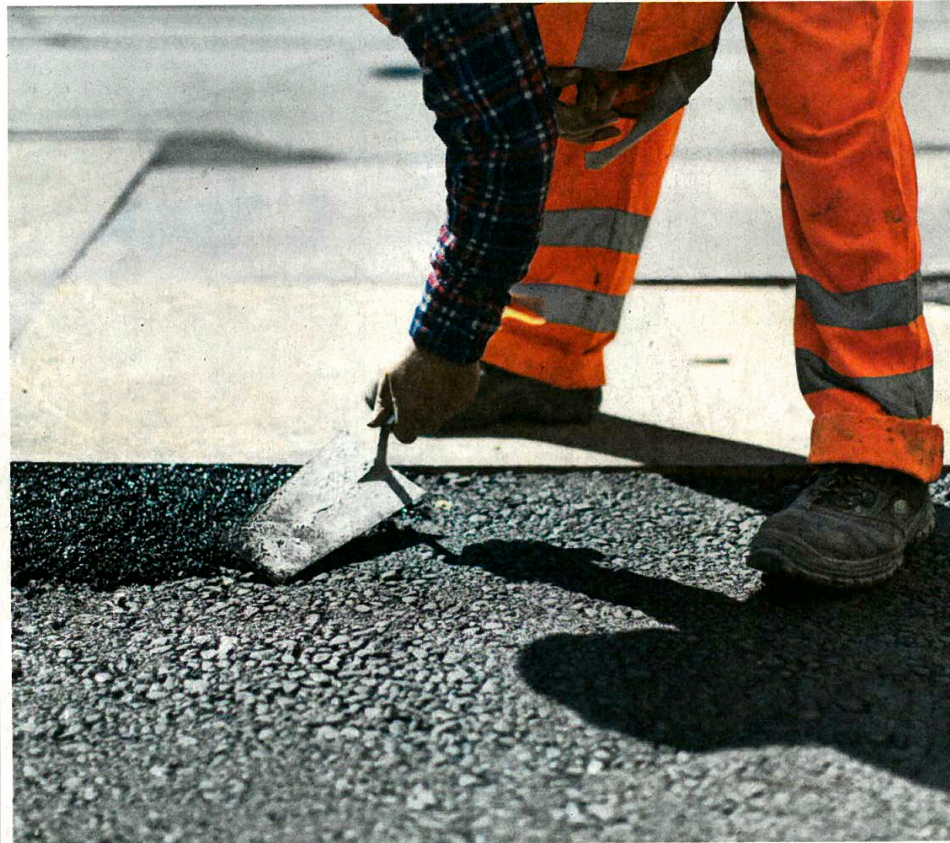
Travail.Suisse demande que l'orientation professionnelle devienne la norme dès 40 ans.

Adultes âgés. Les oubliés de la formation Roland J. Campiche et Afi Sika Kuzeawu