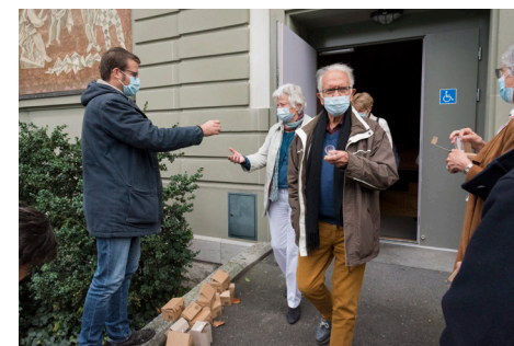
Dans l'incapacité d'organiser un apéritif à l'issue de sa conférence d'ouverture, Connaissance 3 a offert aux participant·e·s des verres à vin, en espérant qu'ils pourront être utilisés lors d'une prochaine rencontre sans gestes barrières.