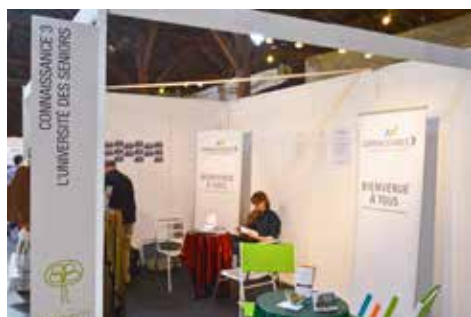
Stand Connaissance 3 au Salon Connect Seniors à Morges, septembre 2014

Si les conférences restent le noyau dur des prestations de Connaissance 3 , cette dernière accorde une place grandissante à deux autres types d'activités qui favorisent la création d'échanges entre les participants : les cours et les visites. L'accent est mis sur l'originalité de l'offre et la diversité des domaines touchés. En outre, une collaboration régulière se met en place avec des institutions culturelles dynamiques : la Maison d'Ailleurs et le Centre d'art contemporain à Yverdon-les-Bains ainsi que la Villa romaine de Pully.