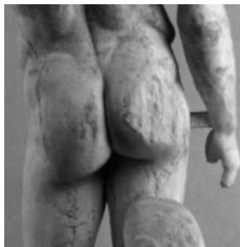
Fig. 8: Victime de son cucul charmant, Stevanos Doryphore Junior a été dépouillé d'une morse de son éminence droite par Mike T. lors d'un combat assidu. A cause de ce malheureux incident, il a été oscarisé uniquement pour sa fabuleuse ampoule sénestre.