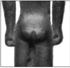
Fig. 3: Voici maintenant Yogos (2570 ans), bien bronzé, qui a le privilège de n'avoir qu'un mamelon. Adepte du push-up (rayon lingerie Coop 5.50 frs, bleu, noir ou blanc), son originalité réside surtout dans son sillon interrompu à mi-parcours.