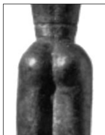
Fig. 1: Nikos, haut de 20 cm, âgé de 2700 ans, porte un pétard de bronze fort chaloupé qui se démarque de sa taille de guêpe.

A cette époque, les excroissances arrières sont pour le moins fantaisistes. Voyez plutôt notre premier modèle: