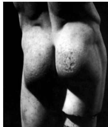
Fig. 9: Feta, qui doit son nom à sa porosité popotine, est notre dernier spécimen en qualité de tumeur classique. Le léger affaissement dont il souffre est moins dû à son âge (environ 2350 ans) qu'au sfumato auquel il est soumis par les rayons illuminateurs d'Hélios, le dieu soleil.