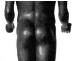
Fig. 5: Pour terminer la rubrique «Archaïsme», nous vous présentons Théodoros, tout de bronze dévêtu. Né en 480 av. J.-C., il incarne la transition entre l'attitude figée de ses prédécesseurs et l'aisance classique. Ses bosselures sont raffermies grâce à Sporelec, ce qui lui permet de maintenir ses travelers chèques bien à l'abri lorsqu'il part au Club Med avec Yogos.