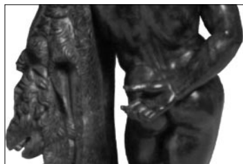
Fig. 11: Carpusi, notre grand timide, nous empêche de visualiser dans leur totalité ses deux excroissances exagérément cotonneuses, ce qui le rend encore plus affriolant.

Nos deux derniers échantillons incarnent l'idéal de la beauté hellénistique dans toute sa splendeur. L'influence héracléenne se fait bien sentir de par leur masse combinant l'adiposité et le muscle. Carpusi et Parakalo, deux jumeaux de 2310 ans, sont les exemples types de cette époque.