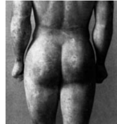
Fig. 4: Alexandropoulos, qui vient de fêter ses 2520 ans, nous propose deux bouffissures bien massives. Fils de Pégase dont il a hérité la croupe, c'est le gagnant des premiers Jeux Olympiques en lutte.