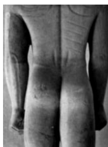
Fig. 2: Mais voilà Alexis qui entre en scène, du haut de ses 2600 ans. Tout de marbre, fier kouros, il possède deux tumuli séparés par un ruisseau asséché qui remonte jusqu'aux épaules. Veuillez l'excuser, il est un peu crispé, c'est son premier défilé.