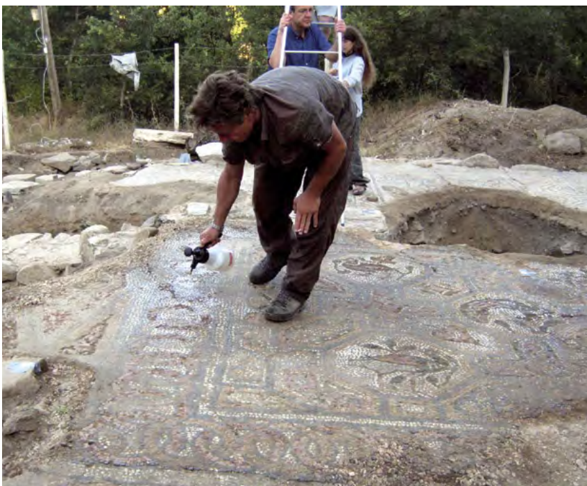
Alain Wagner à l'œuvre sur une mosaïque

présentation au colloque de l'Association internationale pour l'étude de la mosaïque antique, qui vient de se dérouler à Bursa du 16 au 20 octobre 2009. De même, Olivier Feihl (Archéotech SA) est venu scanner par lasérométrie l'ensemble de l'église et faire une couverture photogrammétrique complète des pavements.