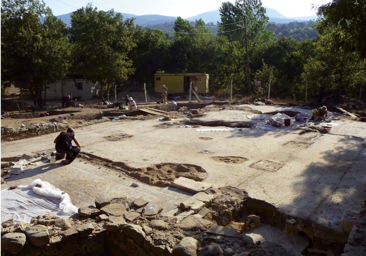
Vue générale du chantier en été 2009

Les sondages effectués en 2009 au nord et au sud de l'église ont également mis au jour plusieurs pièces de dimensions modestes, contemporaines de la deuxième basilique. Ces espaces servaient vraisemblablement de cellules aux moines ou de logements pour les pèlerins.