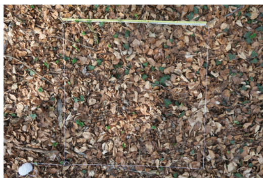
OLn (vue en plan) au début du printemps (fin mars)