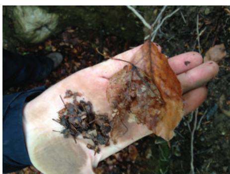
Différence entre un horizon OF, OLv et OLn (fin avril)